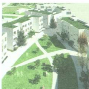
ELLISSE STUDIO SRL