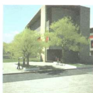
AT e T ASSOCIATI